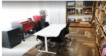
▶ 東京ショールーム