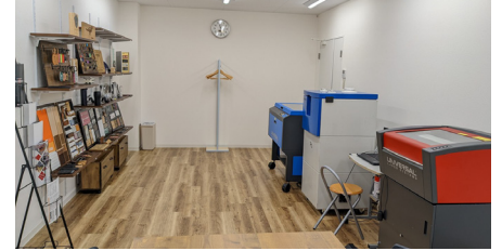
(大阪ショールーム)

異なる機種の性能や発振器出力の違いによる加工時間や加工結果の違い等を実際に体感してみませんか？